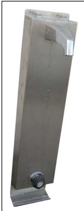
Vor der Aufarbeitung*