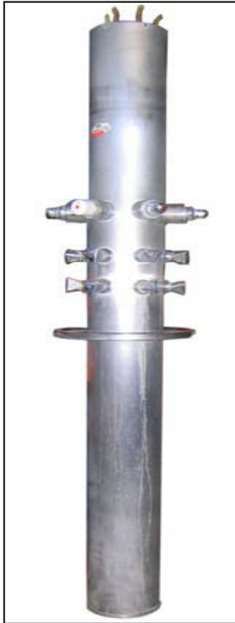
Vor der Aufarbeitung