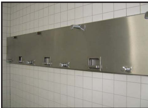
Vor der Aufarbeitung